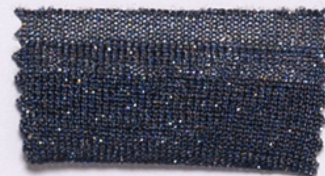
16GG LAMÉ-CROSS 1P